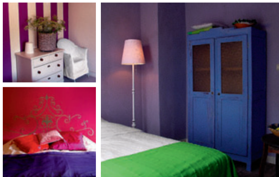
De kamers zijn mediterraan ingericht en hebben elk een eigen thema. Ze doen je zo de koude winter vergeten.

Meer info: B&B Au Foyer, Rue de Marlaine, 6940 Wéris. Tel. 086/32 19 66 en www.aufoyer.com