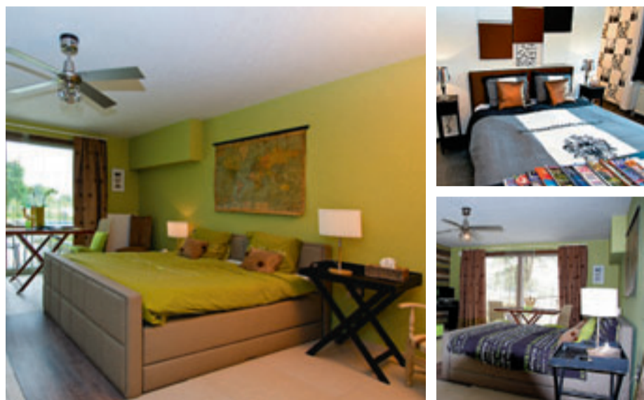
Wie echt behoefte heeft aan rust en ontspanning, kan hier een 'Do Not Disturb'-arrangement boeken.

Meer info: De Witte Merel Deluxe, Tessenderlosteenweg, 3583 Paal. Tel. 011/43 68 76 en www.dewittemerel.com