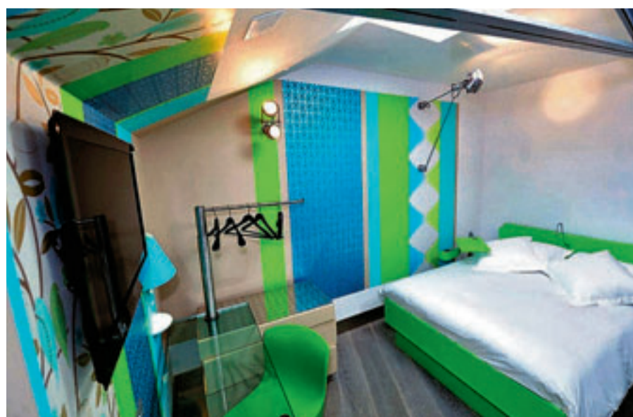
De inrichting combineert trendy meubels met kleurrijk behang.